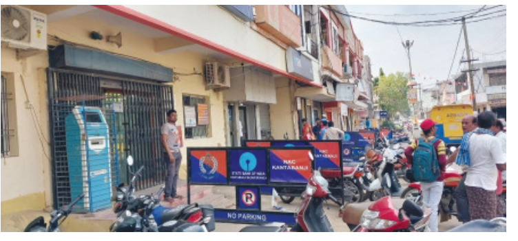
ଟ୍ରାଫିକ ଶାଖା ରହିଛି କିନ୍ତୁ ପାର୍କିଙ୍ଗ ଜାଗା ନ ରହିଥିବାରୁ ବ୍ୟାଙ୍କ କର୍ମଚାରୀ ହେଉ କି ଗ୍ରାହକ ସମସ୍ତଙ୍କ ଗାଡି ପାର୍କିଙ୍ଗ ହେଉଛି ରାସ୍ତା ଉପରେ। ଏନଏସି ପକ୍ଷରୁ ଲାଗିଛି ନୋ ପାର୍କିଙ୍ଗ ବୋର୍ଡ।

କଣ୍ଠାବାଜି (ପିପିଏସ୍): କଣ୍ଠାବାଜି ସହରରେ ମୁଖ୍ୟ ବ୍ୟାଙ୍କ ହୋଇଛି ଟ୍ରାଫିକ ସମସ୍ୟା। ବେଆଇନ ପାର୍କିଙ୍ଗ ରାସ୍ତାକୁ ମାଡି ବସୁଛି, ଯାହାଫଳରେ ରାସ୍ତା ପ୍ରସ୍ତରା ସଂକୀର୍ଣ୍ଣ ହୋଇ ବୃଦ୍ଧି ପାଇଛି ଟ୍ରାଫିକ ଭଳି ସମସ୍ୟା। ସହର ରାସ୍ତା ହେଉ କି ସାଧାରଣ ରାସ୍ତା ସବୁଠି ଏକଭଳି ବେଆଇନ ପାର୍କିଙ୍ଗ ଦୃଶ୍ୟ। ସହରରେ ଯାକିଁ ଛକ ରାସ୍ତାରେ ରହିଥିବା ବ୍ୟାଙ୍କ ଶାଖା ବିଶେଷ ରାଧେରୁକ୍ମଣୀ କଂପ୍ଲେକ୍ସ, ଏହି କଂପ୍ଲେକ୍ସରେ ରହିଛି ଏବ ବି ଆଇ ବ୍ରାଉ ଶାଖା, ଏଡିଏଏଏସି ବ୍ୟାଙ୍କ, ବ୍ୟାଙ୍କ ଅଫ ଚରୋଡା, ଗୋଲଡ଼ କୋଲ ବ୍ୟାଙ୍କ ଓ ଏହା ସହିତ ରହିଛି ଦୁଇଟି ଏଟି ଏମ।