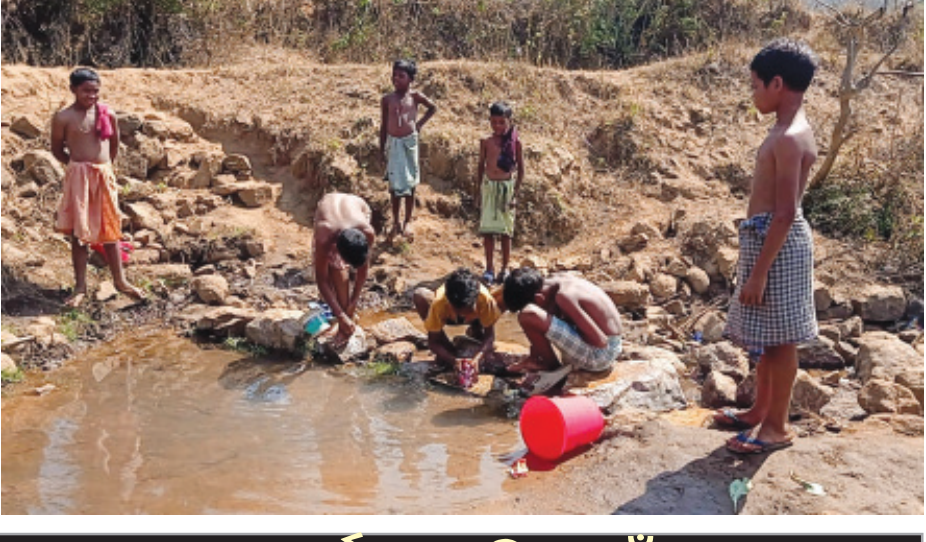
ଗ୍ରାମ୍ୟ ଋତୁ ପୂର୍ବରୁ ପାଣି ପାଇଁ ହାହାକାର

ପାରଳାଖେମୁଣ୍ଡି, (ତାରିଣୀ ପ୍ରସାଦ ପଣ୍ଡା) : ଗଜପତି ଜିଲ୍ଲା ନୂଆଗଡ଼ ବ୍ଲକ ଅନ୍ତର୍ଗତ ପୁରୁପଡ଼ା ସରକାରୀ ଉଚ୍ଚ ବିଦ୍ୟାଳୟ ପରିସରରେ ଗ୍ରାମ୍ୟ ଋତୁ ଆରମ୍ଭ ନ ହେଉନୁ ବର୍ତ୍ତମାନ ସୁଦ୍ଧା ପ୍ରାୟ ମାସାଧିକ ସମୟ ହେଲାଣି ପାଣିର ଉତ୍କଟ ଅଭାବ ଦେଖା ଦେଇଛି । ପାଣିର ଅଭାବ ସମସ୍ୟା ରହିଥିବାରୁ ବିଦ୍ୟାଳୟରେ ଛାତ୍ର ଛାତ୍ରୀଙ୍କ ନିମନ୍ତେ ମଧ୍ୟାହ୍ନ ଭୋଜନ ପ୍ରସ୍ତୁତି, ବିଦ୍ୟାଳୟ ପରିସରରେ ଥିବା ଛାତ୍ରାବାସରେ ରହୁଥିବା ଅନ୍ତେବାସୀ ମାନଙ୍କ ନିମନ୍ତେ ଦୁଇ ଓଜା ରୋଷେଇ କରିବା ଓ ଛାତ୍ରାବାସର ୪୦ଜଣ ଅନ୍ତେବାସୀଙ୍କ ନିତ୍ୟକର୍ମ ବ୍ୟବହାର ନିମନ୍ତେ ଯଥା ଶୈଳୀକର୍ମ, ସ୍ନାନ କରିବା ଓ ପୋଷାକପତ୍ର ସଫା କରିବା ନିମନ୍ତେ ନାହିଁ ନଥିବା ଅସୁବିଧାର ସମ୍ମୁଖୀନ ହେଉଛନ୍ତି । ଏବିଷୟରେ ବାରମ୍ବାର ବିଭାଗୀୟ ଅଧିକାରୀଙ୍କୁ ଅବଗତ