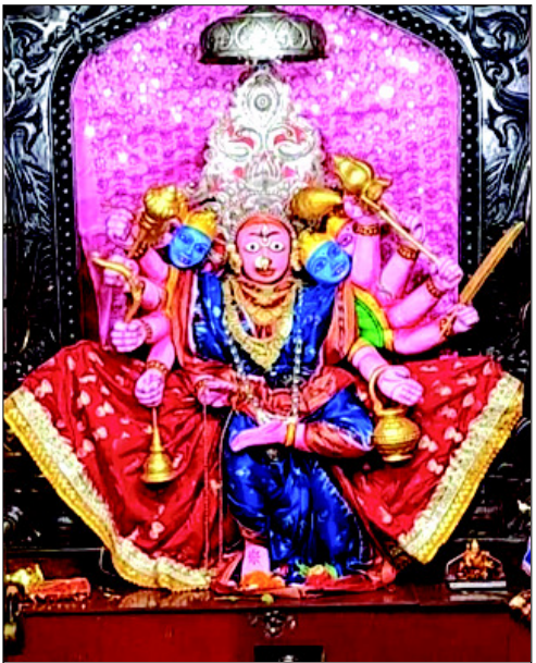
ଗଡ଼ଚଣ୍ଡୀଙ୍କ ଗାୟତ୍ରୀବେଶ ।