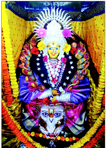
ବାସନ୍ତୀ ଦୁର୍ଗାଙ୍କ କାର୍ତ୍ତାୟିନୀବେଶ ।