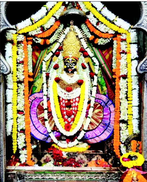
କଟକଚଣ୍ଡୀଙ୍କ ସୁନାବେଶ ।