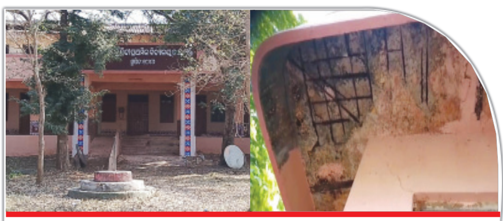
ସରକାରୀ ସ୍କୁଲ ଜମିରେ ବେଆଇନ ନିର୍ମାଣ