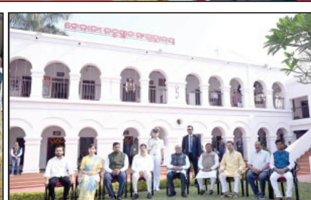
ନେତାଜୀ ଜୟନ୍ତୀ ତଥା ପରାକ୍ରମ ଦିବସ ଅବସରରେ କଟକ ଓଡ଼ିଆ ବଜାରସ୍ଥିତ ନେତାଜୀ ସ୍ମାରଣ ଚନ୍ଦ୍ର ବୋଷଙ୍କ ଜନ୍ମସ୍ଥାନ ନେତାଜୀ ସଦନରେ ଉପରାଷ୍ଟ୍ରପତି, ରାଜ୍ୟପାଳ, ମୁଖ୍ୟମନ୍ତ୍ରୀ, ସାଂସଦ, ବିଧାୟକ ଓ ଅନ୍ୟାନ୍ୟ ଅତିଥିଙ୍କ ଦ୍ୱାରା ବିଭିନ୍ନ କାର୍ଯ୍ୟକ୍ରମ