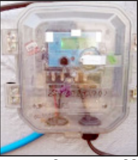
କାକଟପୁର ଅଞ୍ଚଳରେ ଚାଟା ପାଠ୍ୟର କର୍ମଚାରୀ ଏକ ଯଶ ସାହାଯ୍ୟରେ ନାମକୁ ମାତ୍ର ପରାକ୍ଷା କରି ମିଟର ଠିକ ଥିବା ଦର୍ଶାଉଛନ୍ତି ।

ଫଳରେ ପୂର୍ବରୁ ଯାହା ମାସିକ ବିଲ ଆସୁଥିଲା ଏବେ ତାହା ୫ଗୁଣା ବଢ଼ି ଯିବାରୁ ଗ୍ରାହକ ମାନେ ଅସହ୍ୟ ସ୍ୱାଚ୍ଛ ମିଟର ଲଗାଯିବା ପାଇଁ କାକଟପୁର ଓ ଅନ୍ତରଙ୍ଗ ଅଞ୍ଚଳରେ ଅନେକ ଉପଭୋକ୍ତାଙ୍କ ଘରେ ସ୍ୱାର୍ଥ ମିଟରକୁ ବଦଳାଇବା ନେଇ ତୀବ୍ର ଅସହ୍ୟ ସଙ୍ଗଠନ ବିରୋଧାଭାଷ ଜାରି ରହିଛି । ସ୍ୱାର୍ଥ ମିଟର ବଦଳାଇବା ଆଦେଶ ପ୍ରତ୍ୟାହାର କରାଯିବେ ବ୍ୟାପକ ଆନ୍ଦୋଳନ କରାଯିବ ବୋଲି ଉପଭୋକ୍ତା ମତ ଦେଖିଛି । ଚାଟା ପାଠ୍ୟର ନିଷ୍ପତ୍ତି ଅନୁଯାୟୀ ଉପଭୋକ୍ତାମାନେ ମିଟର ଲଗାଯିବେ ମିଟର ଫୁଟିପୁଣି ଯୋଗୁଁ ମାତ୍ରାଧିକ ବିଲ ଆସୁଥିବ ନେଇ