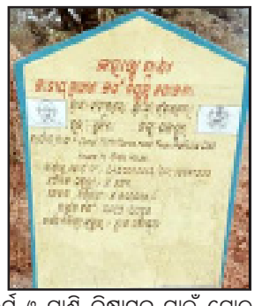
ଯାକପୁର (ପିପିଏସ): ସୁକିନ୍ଦା ବୁକ୍ସ ଅନ୍ତର୍ଗତ ସଂସ୍କରଣ ପଞ୍ଚାୟତର ଅରାସାହି ଗ୍ରାମରେ ଏନଆରକିଏସ ଯୋଜନା ରେ ୫ ଲକ୍ଷ ଟଙ୍କାର ରାଷ୍ଟ୍ରା ନିର୍ମାଣ ପାଇଁ କାର୍ଯ୍ୟାଦେଶ ଆସିଥିଲା । ଏହି ଯୋଜନା ମୁତାବକ ଏହି କାମ ରେ କୌଣସି ମେସିନ କରାଯିବ ନାହିଁ କିନ୍ତୁ ଏଥିରେ ବହୁ ବ୍ୟତିକ୍ରମ ଦେଖାଯାଇଛି । ଏଥିରେ ମଣିଷ ବଦଳରେ ରାତିରେ ମେସିନ କାମ କରୁଛି । ମନଜଳା ରାଷ୍ଟ୍ରା ନିର୍ମାଣ କରି କେଉଁଠି ତ୍ରେନ, କଲଭର୍ଟ ଓ ପାଣି ନିଷ୍କାସନ ପାଇଁ ପୋଲ ହେବ ସେଥିକୁ ଧ୍ୟାନ ନଦେଇ କାମ କରୁଥିବା ଗ୍ରାମ ବାସୀ ଗତ ୨୦/୧/୨୨ରେ ସୁକିନ୍ଦା ମଞ୍ଚଳ ଉନ୍ନୟନ ଉନ୍ନୟନ ଅଧିକାରୀଙ୍କୁ ଲିଖିତ ଅଭିଯୋଗ କରିଥିଲେ । କରୁଥିଲେ କିନ୍ତୁ ମଞ୍ଚଳ ଉନ୍ନୟନ ଅଧିକାରୀ ଏହାର ତଦତ୍ତ କରି ଏ ନେଇ କାର୍ଯ୍ୟାନୁଷ୍ଠାନ ନ ନେବାକୁ ଗତ ୨୯/୧ ରଖିରେ ଗ୍ରାମବାସୀ, ଯାକପୁର ଜିଲ୍ଲାପାଳଙ୍କୁ ଏନେଇ ଲିଖିତ ଅଭିଯୋଗ କରିଛନ୍ତି । ଜିଲ୍ଲାପାଳ ତୁରନ୍ତ ପଦକ୍ଷେପ ଗ୍ରହଣ କରିବାକୁ ଗ୍ରାମବାସୀ ଦାବି କରିଛନ୍ତି ।