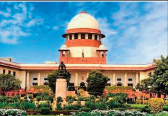
ଆଇନଜୀବୀ ଯୁକ୍ତି ଦେଇଥିଲେ ଯେ, କୋର୍ଟ ନିର୍ବାଚନ କମିସନଙ୍କୁ ଏକ କମିଟି ଗଠନ କରିବାକୁ ନିର୍ଦ୍ଦେଶ ଦେଇପାରିବେ ଏବଂ ଭୋଟ ଦେବାକୁ

ନୂଆଦିଲ୍ଲୀ: ସୁପ୍ରିମକୋର୍ଟରେ ଏକ ଆକର୍ଷଣୀୟ ଆବେଦନର ଶୁଣାଣି ହୋଇଛି । ଆବେଦନରେ ଦାବି କରାଯାଇଥିଲା ଯେ, ଭୋଟ ବାଧ୍ୟତାମୂଳକ କରାଯାଇ ଯେଉଁମାନେ ଜାଣିଶୁଣି ଭୋଟ ଦେବ ନାହାନ୍ତି ସେମାନଙ୍କ ଉପରେ ଦଣ୍ଡ ବ୍ୟବସ୍ଥା ଲାଗୁ କରାଯାଇ । ଏପରି ବ୍ୟକ୍ତିମାନଙ୍କୁ ସରକାରୀ ସୁବିଧାକୁ ବଞ୍ଚିତ କରାଯିବା ଉଚିତ । ପ୍ରଧାନ ବିଚାରପତି ସୂର୍ଯ୍ୟକାନ୍ତ ଅଧ୍ୟକ୍ଷତାରେ ଗଠିତ ଖଣ୍ଡପୀଠ ମାମଲାର ଶୁଣାଣି କରିବାକୁ ମନା କରି କହିଛନ୍ତି ଯେ, କାହାକୁ ଭୋଟ ଦେବାକୁ ବାଧ୍ୟ କରାଯାଇପାରିବ ନାହିଁ । ଗଣତନ୍ତ୍ରରେ ଭୋଟ ନିଜସ୍ୱ ଗୁରୁତ୍ୱ ଅଛି । ଲୋକଙ୍କୁ ଏହା ବିଷୟରେ ସଚେତନ କରାଯାଇପାରିବ, କିନ୍ତୁ ଆଇନଗତ ଭାବରେ ସେମାନଙ୍କୁ ଏପରି କରିବାକୁ ବାଧ୍ୟ କରାଯାଇପାରିବ ନାହିଁ । ଆବେଦନକାରୀଙ୍କ ପ୍ରତିନିଧିତ୍ୱ କରୁଥିବା