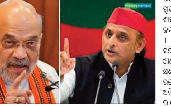
ମୁସଲମାନଙ୍କ ପାଇଁ ସଂରକ୍ଷଣ ପାଇଁ କୌଣସି ପ୍ରସ୍ତାବ ଗ୍ରହଣ କରିବେ ନାହିଁ । ଏହା ସମ୍ପର୍କରେ ବିରୋଧରେ । ସମାଜବାଦୀ ପାର୍ଟି ଯଦି ତାହା ସେ ତାର ସମ୍ପୂର୍ଣ୍ଣ ଚିନ୍ତାକୁ ପୁସ୍ତକି ମହିଳାଙ୍କୁ ଦେଇ ଦେଉ ଆମର କିଛି ଆପତ୍ତି ନାହିଁ । ଅଖିଲେଶ ଯାଦବ ମଧ୍ୟ ଜରୁରୀତା ଉପରେ ପ୍ରଶ୍ନ ଉଠାଇଥିଲେ । ସେ କହିଥିଲେ ଯେ ୨୦୨୫ ଜନଗଣନା କରାଯିବ ଉଚିତ୍ ଏବଂ ଜାତିଗତ ତଥ୍ୟ ଉପଲବ୍ଧ ହେବା ଉଚିତ୍ ତା ପରେ ଏହା